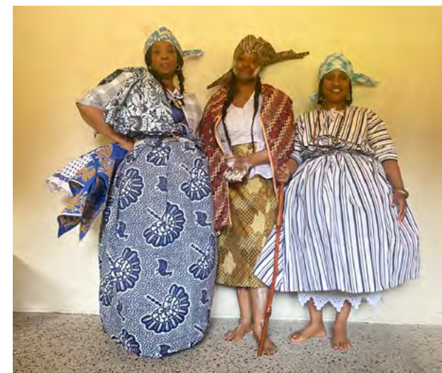
^ Kotomisi's – vrouwen in traditionele Creools-Surinaamse kledij – te gast bij de Winti-ceremonie in Buitenplaats Doornburgh.