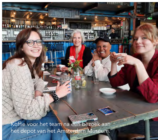
Koffie voor het team na een bezoek aan het depot van het Amsterdam Museum.