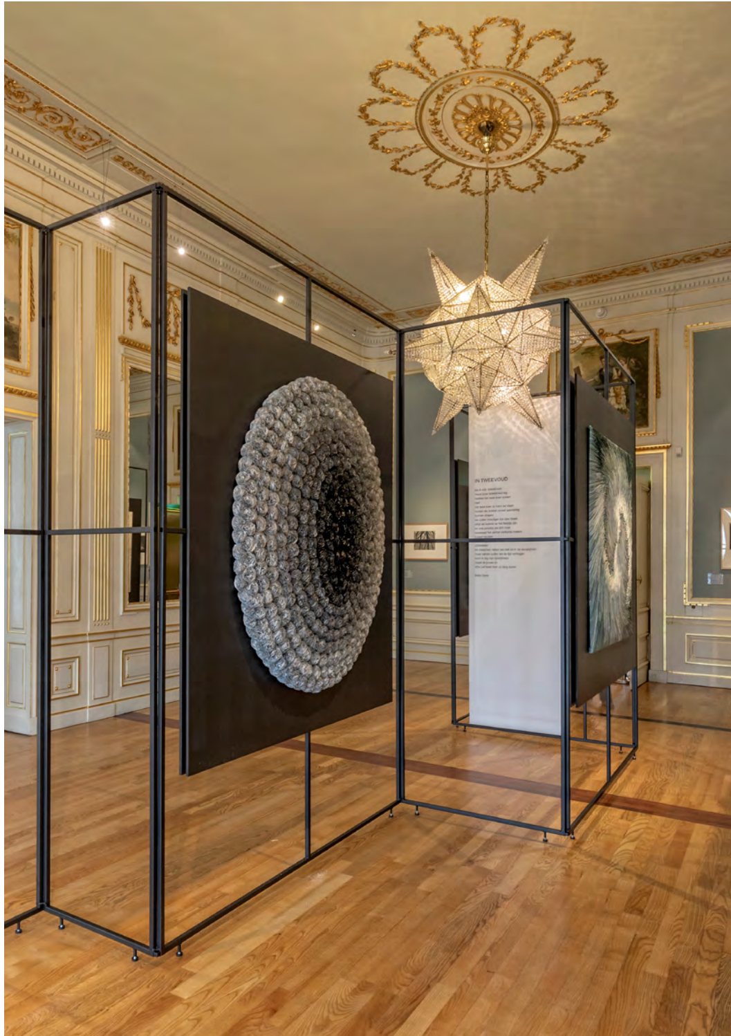
Tijd en Eeuwigheid te gast in Escher in Het Paleis, Den Haag