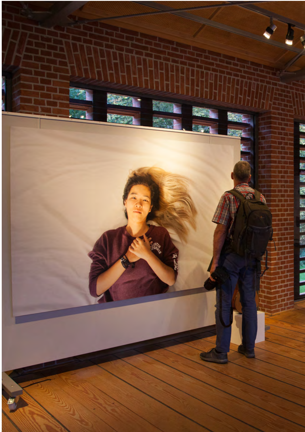
Dit is mijn verhaal in Museum Klooster Ter Apel