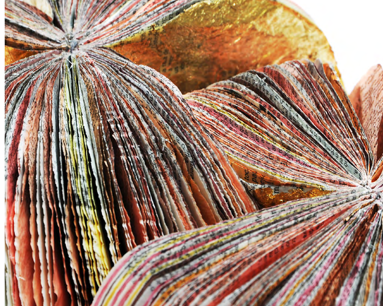
Gekwetter Rondon van Annita Smit (detail) uit de tentoonstelling Tijd en Eeuwigheid

Een auditcommissie bestaande uit twee toezichthouders ondersteunt de raad van toezicht bij het uitvoeren van de toezichthoudende functie, in het bijzonder op het gebied van financieel toezicht. De commissie rapporteert aan de RvT. De auditcommissie kwam in 2021 twee keer bijeen, een keer om de concept-jaarrekening met de directeur en de interne accountant te