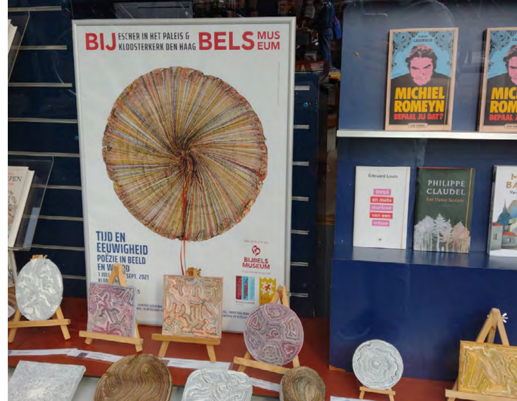
Boekhandel Douwes in Den Haag wijdde zelfs een etalage aan de tentoonstelling Tijd en Eeuwigheid

Het Bijbels Museum heeft drie medewerkers in loondienst. De directeur, de medewerker