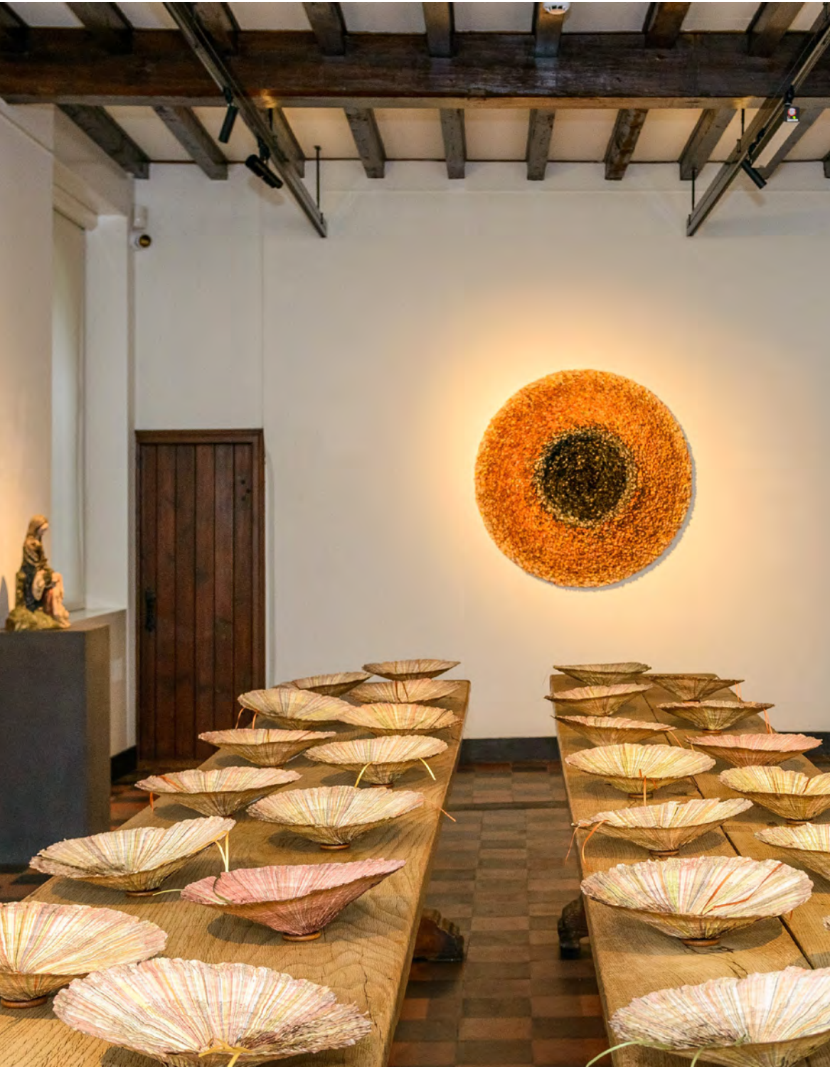
Tijd en Eeuwigheid in Museum Krona te Uden