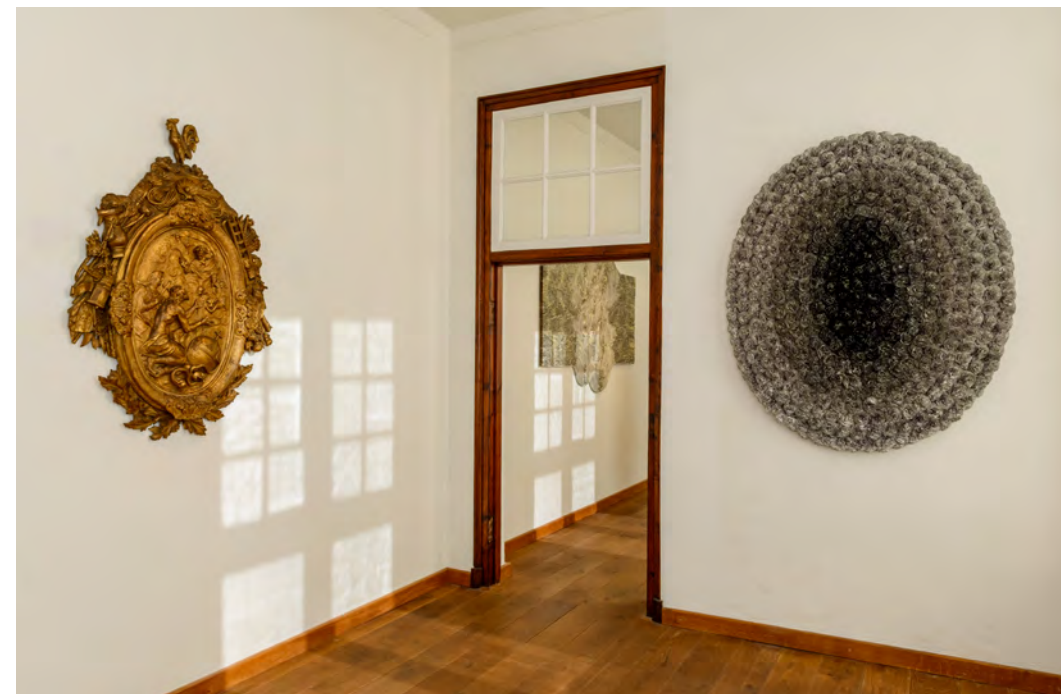
Tijd en Eeuwigheid in Museum Krona te Uden