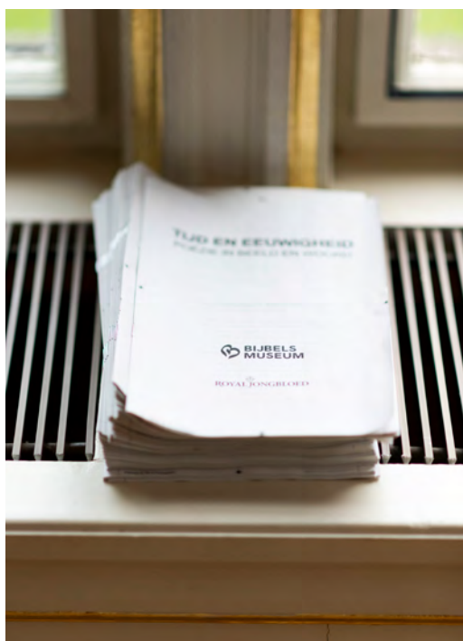
Katern Tijd en Eeuwigheid, gedrukt i.s.m. Royal Jongbloed