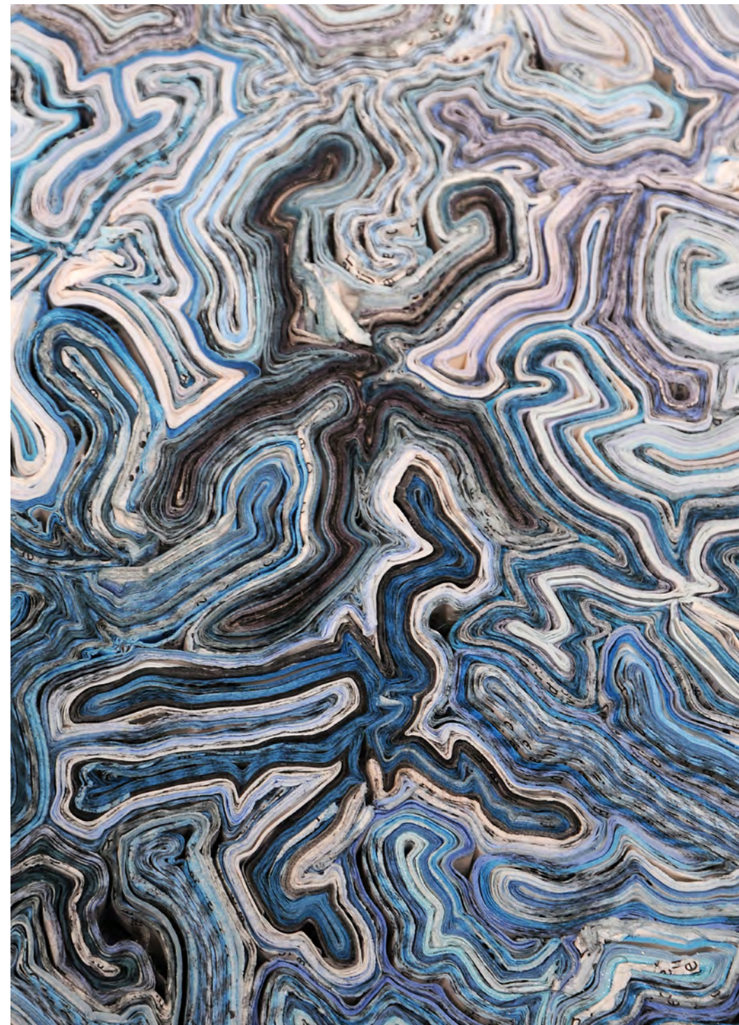
Onderweg van Annita Smit (detail)