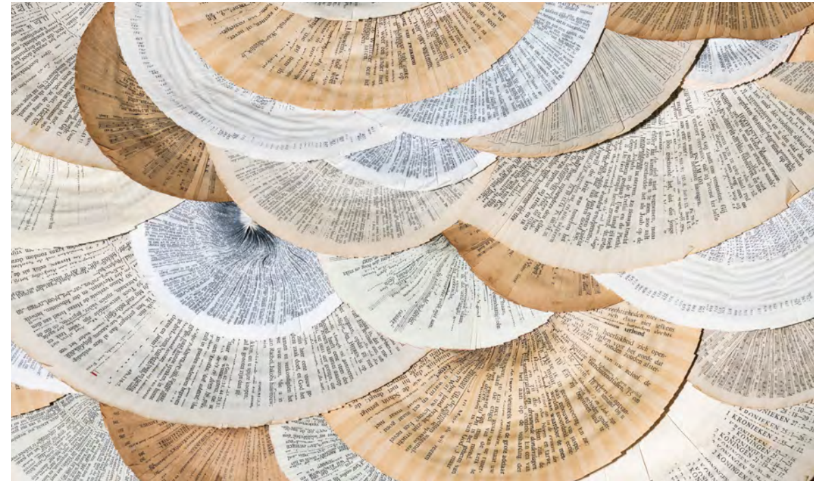
Bloemlezing (detail) van Annita Smit uit de tentoonstelling Tijd en Eeuwigheid