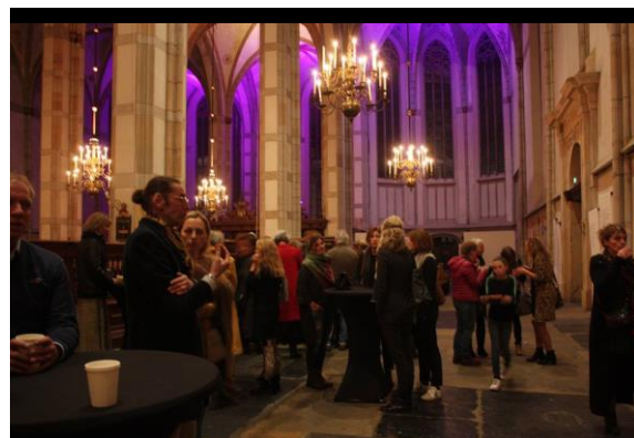
Diverse activiteiten Zondvloed nu in Zwolle en aankondiging activiteit Amsterdam.