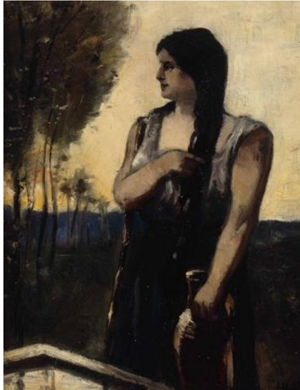
'Rebekka am Brunnen', 1908-1909, Lesser Ury