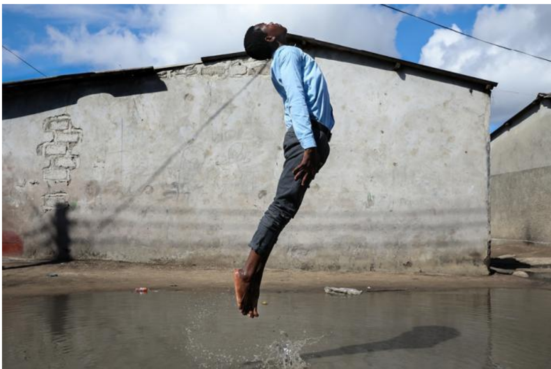
'Arthur', foto Cigdem Yuksel voor Zondvloed nu

Negen talentvolle jonge fotografen – aanstormend of al gevestigd – uit Amsterdam, Den Haag en Zwolle kregen de uitnodiging om een of meerdere nieuwe werken te maken als bijdrage voor de tentoonstelling Zondvloed nu . De vraag aan de kunstenaars was om de betekenis van het zondvloedverhaal voor de huidige tijd te verbeelden. De artistieke kwaliteit van het resultaat was hoog. Zeven 'verhalenexperts' uit de drie monotheïstische godsdiensten (theologen, een rabbijn, islamdeskundigen en een mythedeskundige) werden gevraagd een verhaal te schrijven over de betekenis van de zondvloedmythe. Het resultaat: een tentoonstelling op drie locaties, een boek en acht