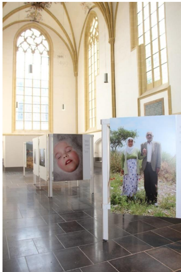
Zie mij in de Walburgiskerk te Zutphen

Met de fototentoonstelling Zie mij: De Bijbel in 609 foto's beoogt het Bijbels Museum een breed publiek aan te spreken. Behalve door de herkenning die optreedt vanwege de diversiteit van de in beeld gebrachte mensen, landschappen en culturen, en door het aanbieden van de teksten in verschillende talen, wordt dat publiek ook actief gezocht door de tentoonstelling op verschillende (publieke) locaties in het land te exposeren.